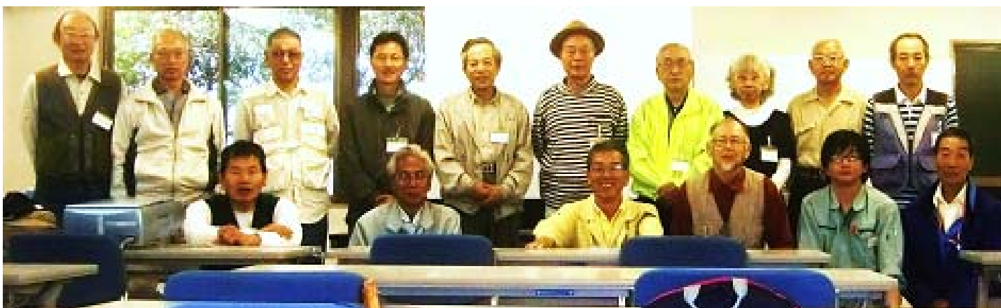
座学の後で“受講生、スタッフ”と記念撮影、「大阪府管理事務所」